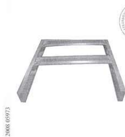
1.1 Bina Ara Kat Karkası