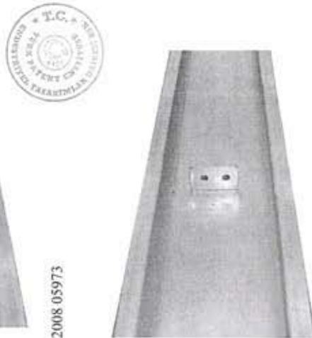
2.1 Bina Ara Kat Karkası