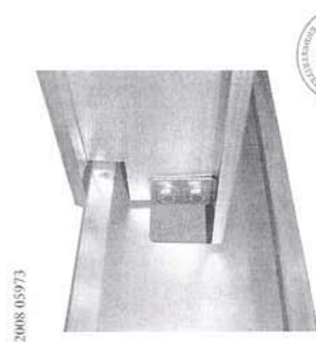
1.3 Bina Ara Kat Karkası