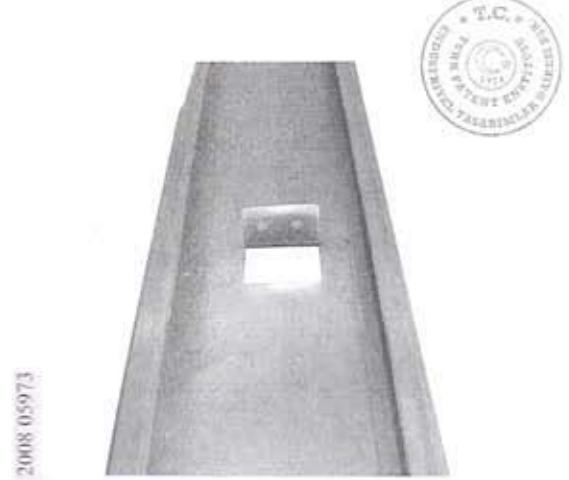
2.2 Bina Ara Kat Karkası